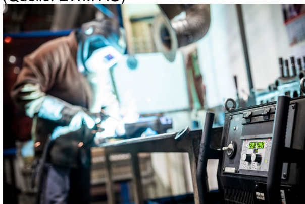
Abb. 2

Die Welding 4.0-Schweißmanagement-Software ewm Xnet erfasst den gesamten Wertschöpfungsprozess des Schweißens intelligent in einem digitalen System und bildet den direkten Draht zum Anwender.