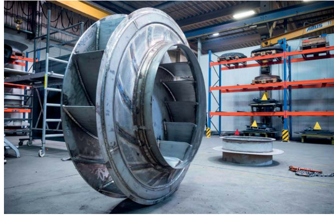
Ein geschweißtes Lüfterrad mit 3,5 Meter Durchmesser. Inklusive der Versteifungsringe befinden sich hier über 60 Meter Schweißnähte in dem Bauteil.